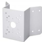
SNCA-CM- 4670 (Eckadapter)