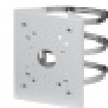
SNCA-PM- 4660 (Mastadapter bis 127mm)