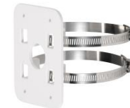
SNCA-PM- 4661 (Mastadapter 80-130mm)