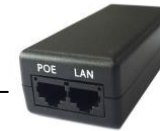
SANPOWER-MS01L (POE Netzteil)